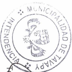
Ceofilo Báez Caballero